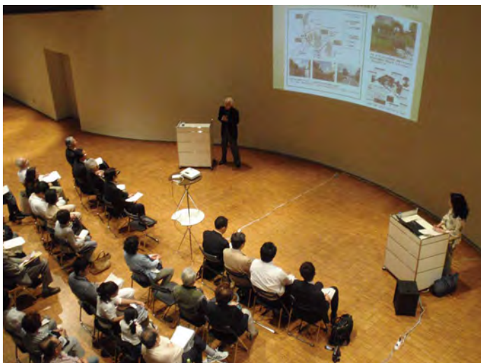
2014年5月18日 池田山住環境協議会設立総会